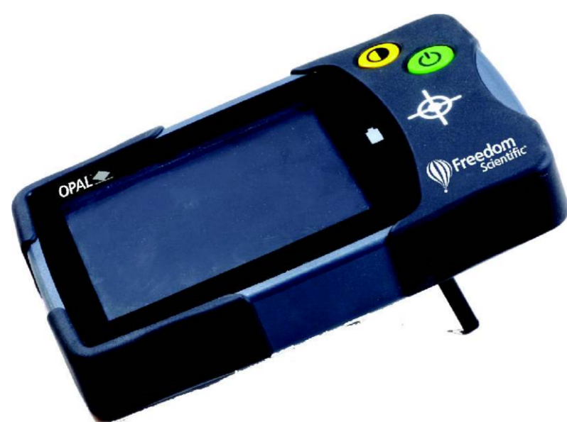
Elektronische Lupe für unterwegs

Wir helfen Ihnen! Sehbehindertenberatung hier!